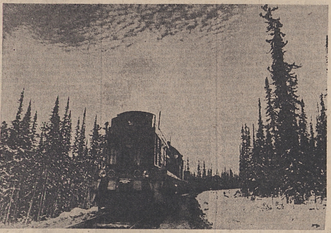
ZSRR. Ostatnie kilometry kolejnego odcinka BAM-u między granicą obwodu irkuckiego a stacją Dawan na terenie Buriackiej ASRR.