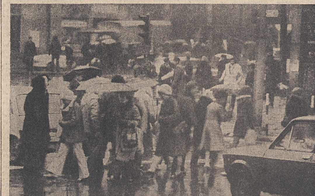
(P) Pierwszy tegoroczny śnieg w Warszawie.

kadr, szczególnie do prac dołowych skłoniły do podjęcia szeregu działań, mających na celu zwiększenie zainteresowania pracą w kopalniach miedzi. (DOKONCZENIE NA STR. 6)