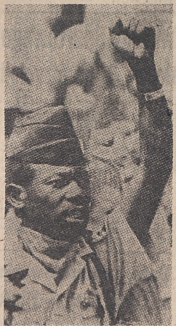
W dawnym pałacu cesarskim mieści się obecnie Derg, na którego czele stoi pułkownik Mengistu Haile Mariam

stwa Czarnego Łądu, w jeden z najbardziej rewolucyjnych krajów kontynentu. Zwrocone są na nią oczy całej Afryki. Czarny Łąd przysięga się kolejnym etapom procesu rewolucyjnego, zdając sobie sprawę, że oto obróciło się kolo historii. Do groń postępowych krajów Trzeciego Świata przybył jeszcze jeden. Przejrzyj to te same trudności, jakie zanotowane są w historii wszystkich krajów rozwijających się, które bądź to wyzwoliły się z okowów kolonializmu, bądź też przeprowadziły w nich rewolucję, obalając poprzedni system społeczny. Brak kadry, środków na rozwój gospodarczy. Listę potrzeb można ciągnąć długo. W Etiopii także mamy z tym do czynienia. Trzeba jednak odnotować i suk-