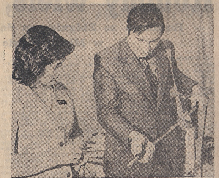
Zakład Zaopatrzenia Ogrodniczego WSO w Warce zaopatrza ogrodników i sadowników w sprzęt ochronny ogrodniczy, roślinny w skali całego województwa. Tutaj wreszcie w Nowej Wsi znajduje się Instytut Sadowniczy ściśle współpracujący z naukowym ośrodkiem w Skierniewicach. A