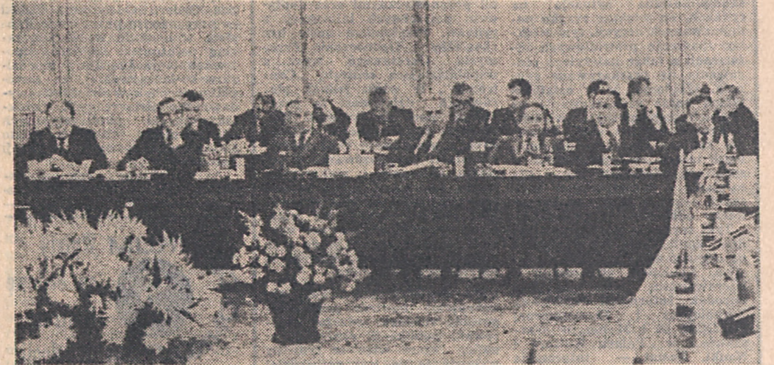
(P) Polska delegacja pod przewodnictwem Edwarda Gierka podczas obrad Doradczego Komitetu Politycznego Państw-Stron Układu Warszawskiego w Moskwie 22 bm.

MOSKWA (PAP). W środę w Moskwie rozpoczęły się obrady kolejnego posiedzenia Doradczego Komitetu Politycznego Państw-Stron Układu Warszawskiego.