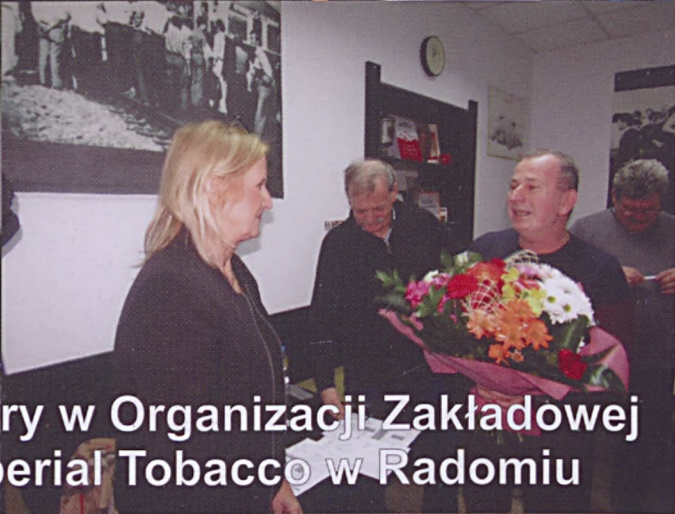
Wybory w Organizacji Zakładowej w Imperial Tobacco w Radomiu