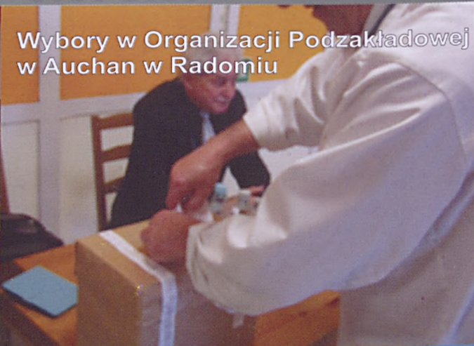
Wybory w Organizacji Podzakładowej w Auchan w Radomiu