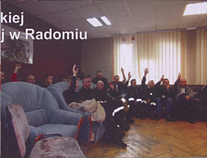
Wybory w Komendzie Miejskiej Państwowej Straży Pożarnej w Radomiu