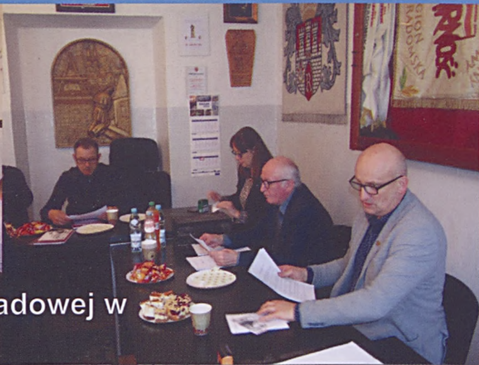
Wybory w Organizacji Podzakładowej w Poczta Polska S.A. w Radomiu