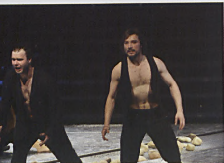
fol. K. Strudziński