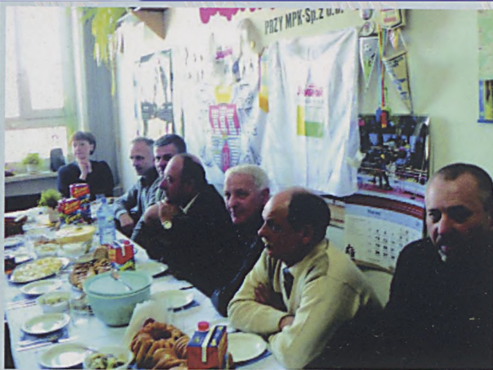
Spotkanie wielkanocne Komisji Zakładowej NSZZ „Solidarność” w MPK Radom sp. z o.o. 4.04.2012 r.