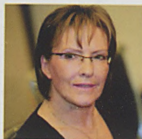
Ewa Kopacz PO