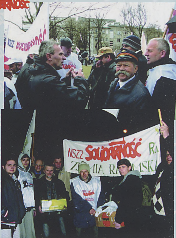
Związkowcy z NSZZ „Solidarność” Ziemia Radomska Rolników Indywidualnych dostarczyli 28/29 marca żywność dla „maisteczka namiotowego” pod Sejmem

jący się do siedemdziesięciu lat mogli pracować w swoich zawodach z równą wydajnością, jak robili to wcześniej. Trzeba znaleźć rozwiązanie elastyczne, miękkie, przede wszystkim dobre dla ludzi, zachęcające ich do dłuższej aktywności zawodowej, a w konsekwencji dobre dla równowagi demograficznej na rynku pracy.”