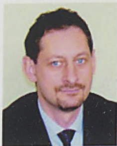
Armand Ryfiński Ruch Palkota