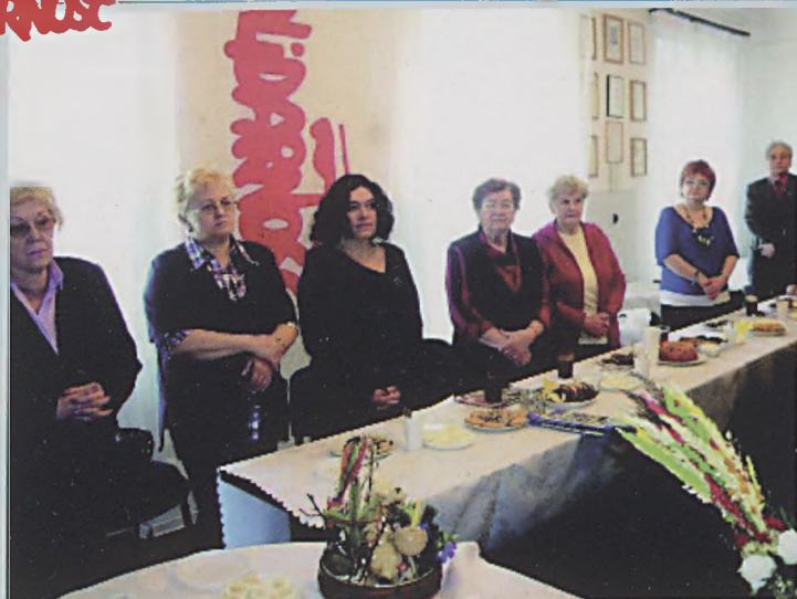
Spotkanie wielkanocne Terenowej Komisji Emerytów i Rencistów przy Zarządzie Regionu NSZZ „Solidarność” Ziemia Radomska - siedziba ZR, 4.04.2012 r.