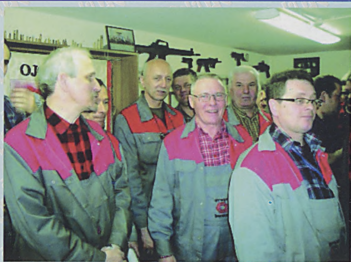
Spotkanie wielkanocne Komisji Zakładowej NSZZ „Solidarność” w Fabryce Broni sp. z o.o. 4.04.2012 r.