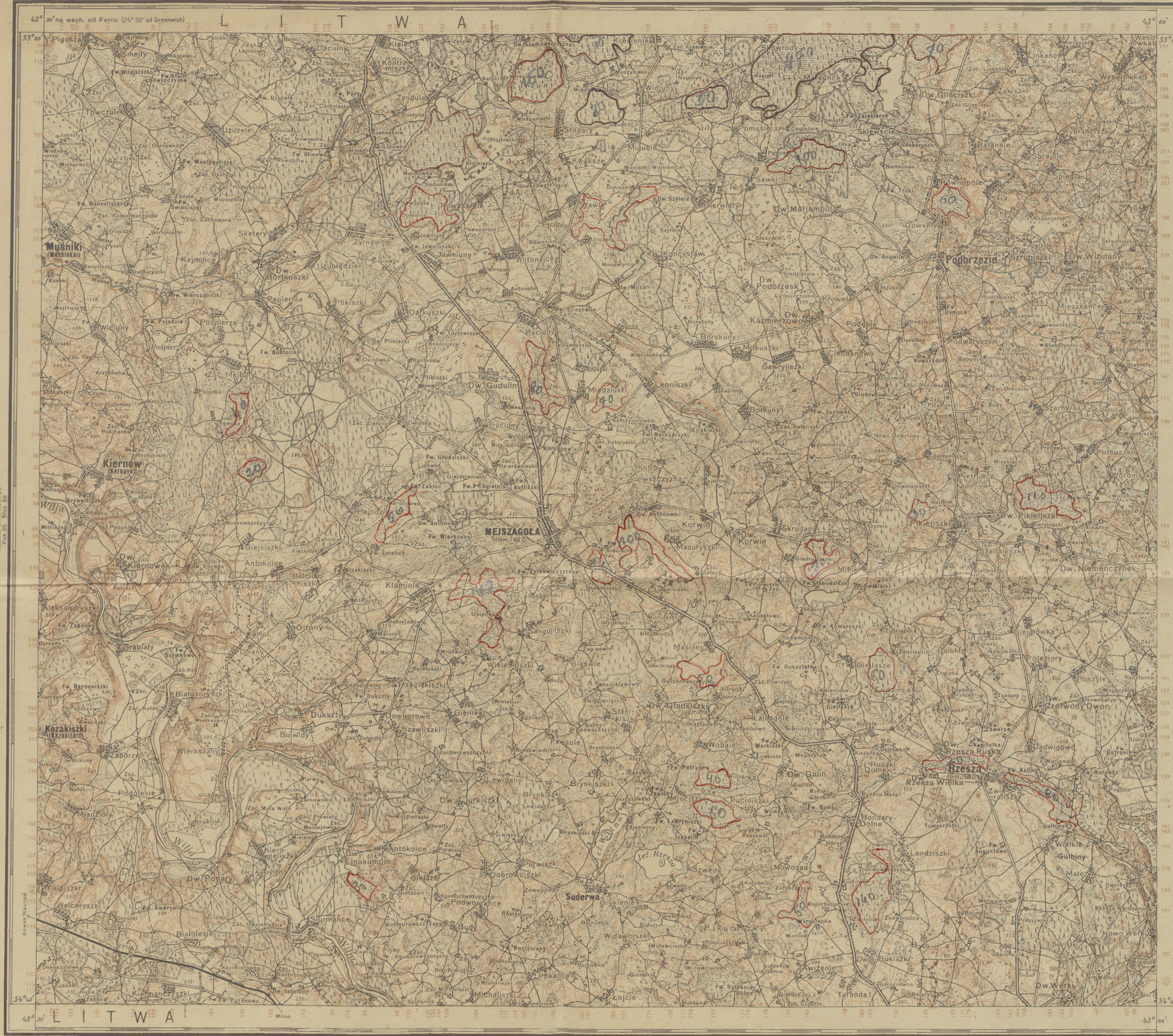
Objasnienie odczytywania warstwic arkusza MEJSZAGOLA